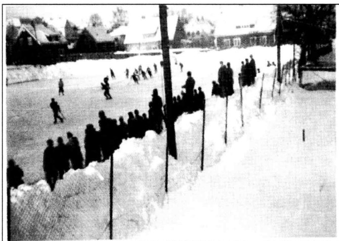
Bandykamp på 1950-tallet på Wiesebanen.

Bildet er fra ”Bydalen –Litt av hvert om dalen vår” og viser at det er lang tradisjon å gå på skøyter på Wiesebanen.